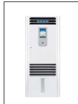
ピュアウォッシャー