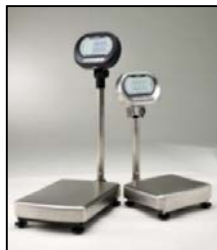
デジタル台はかり