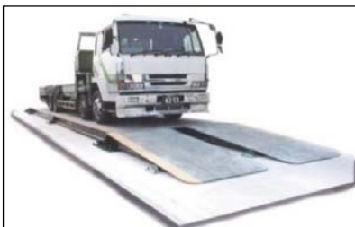
トラックスケール