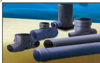
下水道用パイプ 下水道用マンホール継手