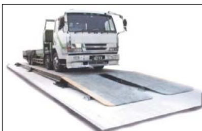
トラックスケール