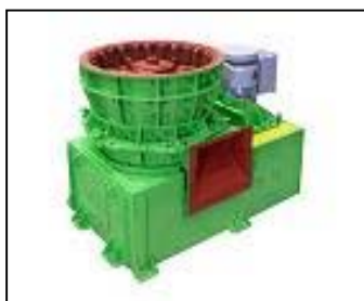
アイダル (豎形回転式破碎機)