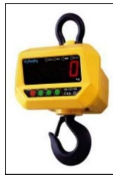
ホイスースケール