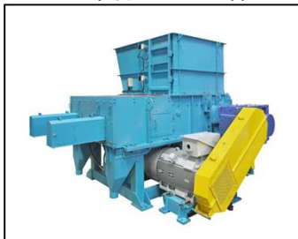
マスチフ (一軸破碎機)