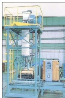
フレコンボックスケール