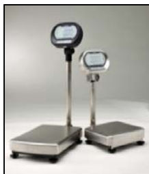
デジタル台はかり