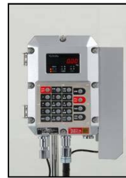
充填機専用型 指示計