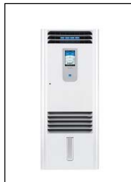
ピュアウォッシャー