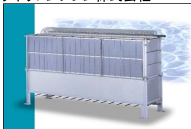
浸漬型膜分離装置