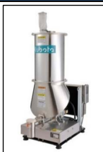
カセットウイングフィーダ