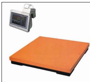
中・大型 台はかり